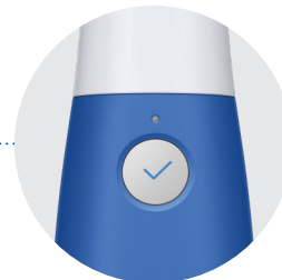
Botón de Inicio de Escaneo