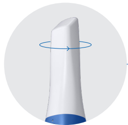
Punta reversible de 180°